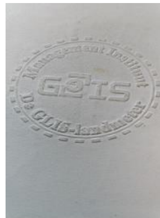
2. Voorbeeld Achterzijde bedrijfsbadge