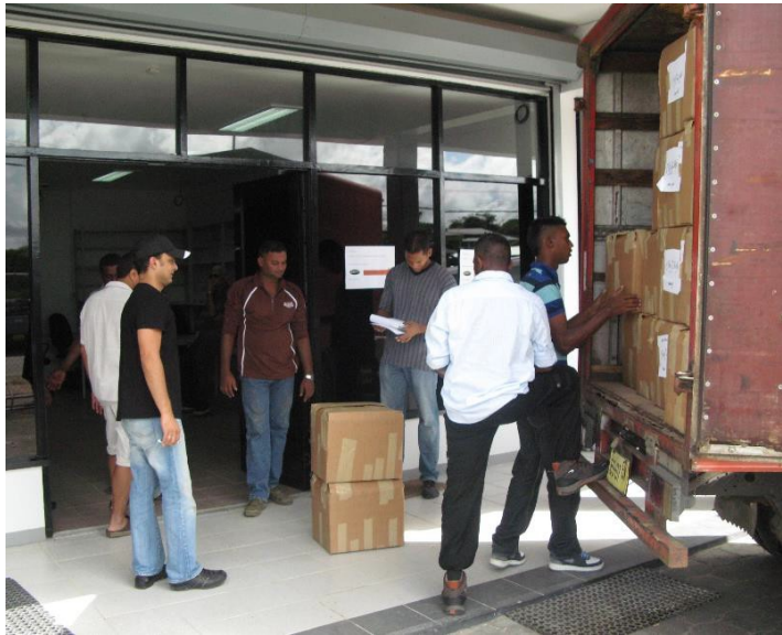
Uitladen van registers tijdens de verhuizing

Een belangrijke gebeurtenis in 2012 is geweest de verhuizing van de openbare registers van het oude, zeer deplorabele kantoor aan het Kerkplein naar de Primulastraat op 1 juli. De verhuizing is vlekkeloos verlopen hoofdzakelijk vanwege de markante inzet van het personeel van de "Bewaarderij", ondersteund door militairen, de politie en overige personeelsleden. Met deze verhuizing zijn alle werkzaamheden verplaatst naar de Primulastraat en werden modernere werkprocessen ingezet. Deze verhuizing was een enorme uitdaging voor het hele Instituut aangezien de werkzaamheden van de "Bewaarderij" nu met ca. 50% van het personeel moesten plaatsvinden, op een nieuwe locatie, volgens nieuwe processen en binnen een andere structuur. Bovendien bestond de zorg dat het publiek hier veel ongemak van zou ondervinden. Terugblikkend mag gesteld worden dat de aanpassing van zowel het personeel als het publiek binnen enkele maanden een feit was. Constante monitoring en begeleiding van het personeel hebben ervoor gezorgd dat de transitie een succes was.