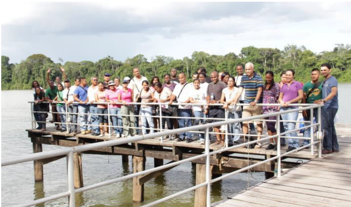
Teambuilding te Berg en Dal

De beleidsvoering binnen het MI-GLIS voor wat betreft de "Bewaarderij" verloopt op twee sporen. Enerzijds wordt gewerkt aan de conservering van de papieren registers die volgens de wet nog steeds het referentiekader vormen van de "Bewaarderij". Anderzijds wordt gewerkt aan de vervolmaking van het digitale GIS systeem waar de openbare registers worden gekoppeld aan geodetische informatie. Hoewel hier sprake is van twee duidelijk te onderscheiden sporen vindt er een continu proces van versmelting plaats. Zo worden de papieren registers meer en meer ondersteund door digitale hulpprogramma's die het zoeken en de productie van uittreksels aanmerkelijk vergemakkelijkt. Uiteindelijk zullen de twee sporen samensmelten waarbij sprake zal zijn van een volledig gedigitaliseerd systeem. Deze benadering wordt gezien als de enige benadering om een gedegen en betrouwbaar systeem te kunnen garanderen. Hierdoor kan het MI•GLIS steeds efficiënter en sneller aan de groeiende vraag naar producten van het publiek voldoen.